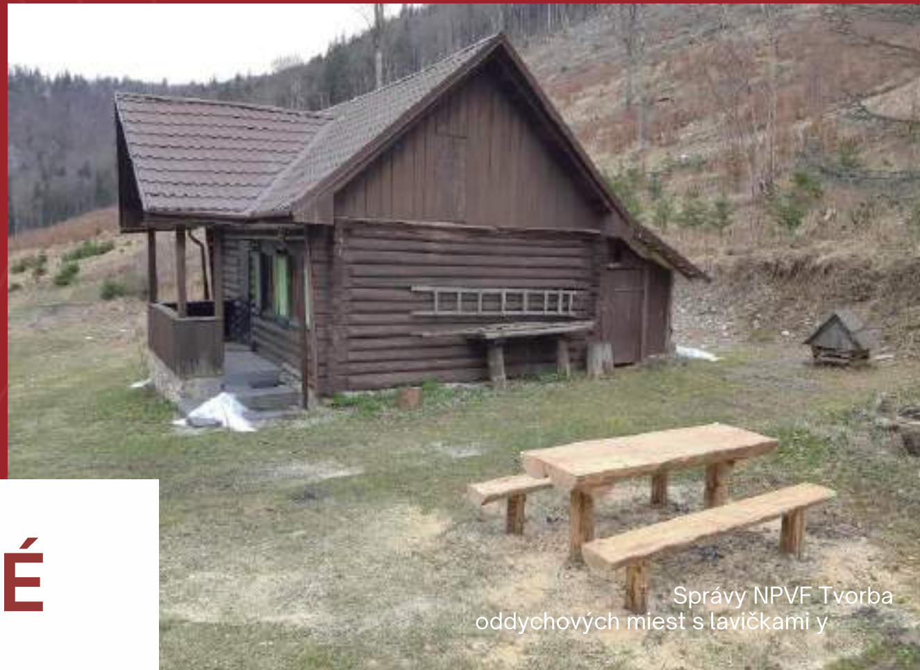
Správy NPVF Tvorba oddychových miest s lavičkami y